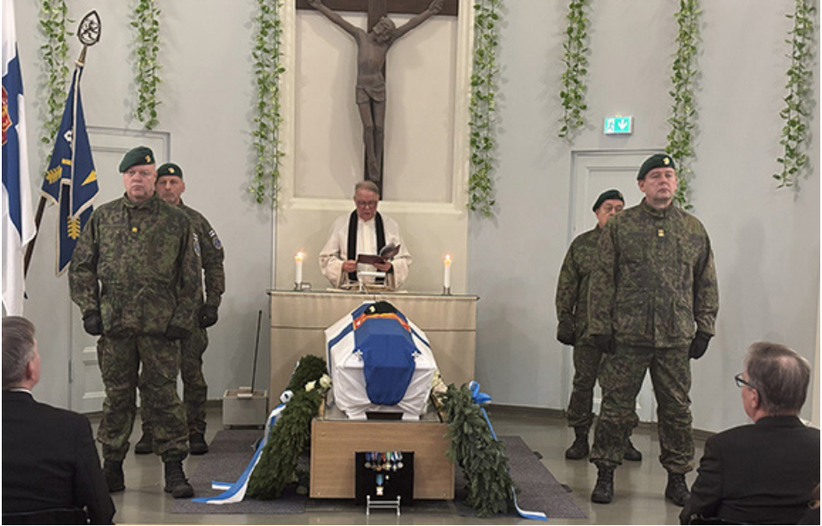
Ension hautajaiset Kouvolan vanhan hautausmaan kappelissa

suurempi kuin suomalaisten. Vaikka väylä oli Suomen vetäytyttyä auki, ei Neuvostoliitto lopulta lähtenyt yrittämään enää hyökkäystä mantereelle.