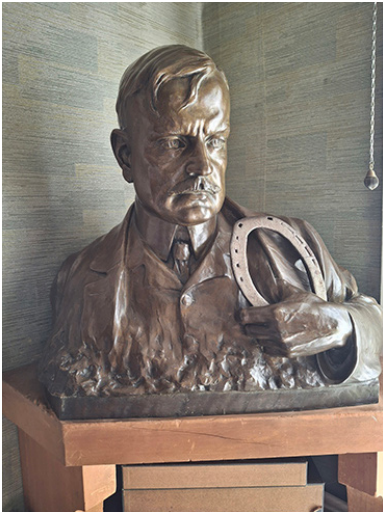
Sibelius Ainola: Jean Sibelius