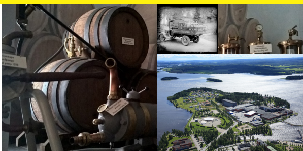
Vuosikokous Iisalmissa 6.6.2026