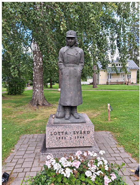
Lottamuseo - Lotta-patsas