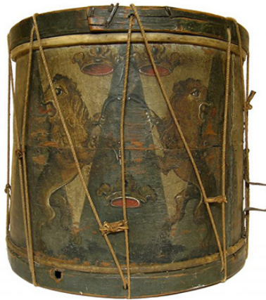
Rumpu Ruotsi Musimuseum.